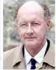
Sul palco Una passata edizione dell' Acqui Storia . A destra, Yves De Gaulle, ospite quest'anno